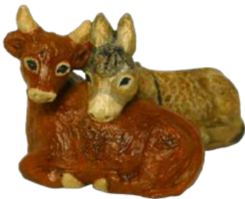
Âne et bœuf 6,4 x 10,7 cm réf. : crB A&B. 29 € TTC