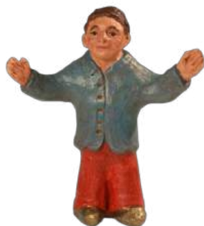
Ravi 17 cm réf. : crA RAV. 44 € TTC