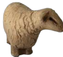
Brebis Lacaune 5,5 x 3,5 x 3 cm réf. : crB BRE a - 6 € TTC