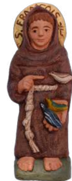
saint François 21 cm ; réf. : muFRA. 39 € TTC