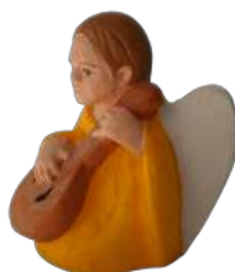
Ange 5,7cm réf. : crB ANG. 24,90 € TTC