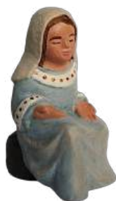
Marie 6,3 cm réf. : crB MAR. 24,90 € TTC