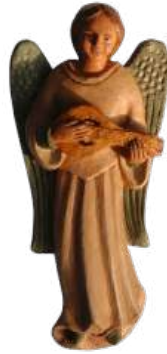
Ange au luth (grège) ; 24 cm réf. : muANG b. 47,50 € TTC