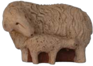
Brebis à l'agneau 5,7 x 8,2 x 5 cm réf. : crA BRA. 14,50 € TTC