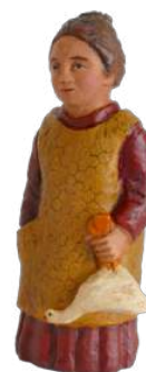
Femme à l'oie 16 cm réf. : crA OIE. 44 € TTC