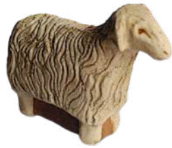
Brebis 7 x 9,7 x 3,2 cm crA BRE a, b, c, d, e (voir ci-contre) 12 € TTC