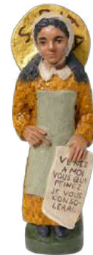
sainte Rita ; 21 cm réf. : muRIT. 39 € TTC