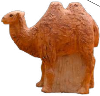
Chameau 9,5 cm réf. : crB EUR. 28 € TTC