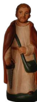
saint Joseph 21,5 cm réf. : stJOS. 53 € TTC