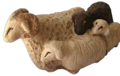
Moutons (bloc) réf. : crB MOU. 13 € TTC