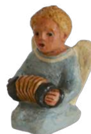
Ange bleu 5,7 cm réf. : crA ANG. 32 € TTC