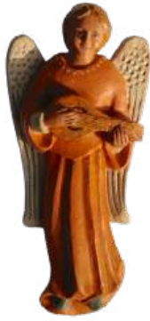
Ange au luth (feu) ; 24 cm réf. : muANG a. 47,50 € TTC

Attache pour suspension murale. NB : l'échelle relative des pièces n'est pas respectée.