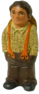
Homme aux bretelles 9cm réf. : crB BRT. 24,90 € TTC