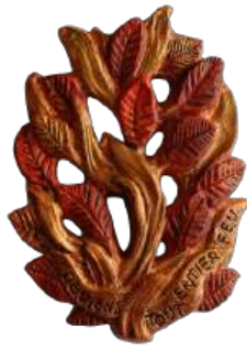
Buisson ardent (doré) 20 cm ; réf. : muFEU b. 35 € TTC