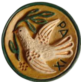
Colombe, médaillon. 11,4 cm réf. : brCOL. 28 € TTC