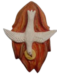
Saint Esprit (confirmation) ; 16,5 x 12,5 x 1,5 cm réf. : muESP. 36 € TTC