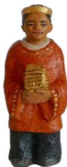
Mage d'Asie 17,5 cm réf. : crA ASI. 45 € TTC