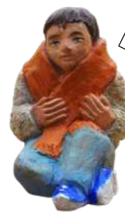
Le Pauvre 9 cm réf. : crA PAU. 32 € TTC