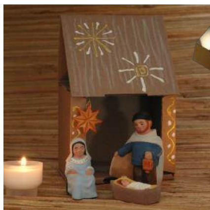
Coffret Nativité réf. : crB NAT. 52 € TTC