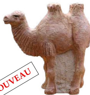
Chameau ; 20,5 x 20 x 6 cm réf. : crA CHA. 69 € TTC