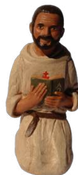
Charles de Foucauld 16,5 cm réf. : stCHA. 52 € TTC