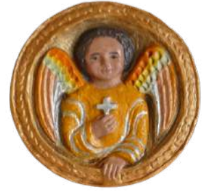
Ange, médaillon (jaune) 11 cm ; réf. : brANG b. 30 € TTC