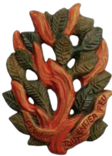
Buisson ardent (vert) 20 cm réf. : muFEU a. 35 € TTC