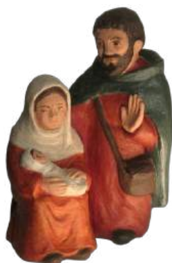
sainte Famille (bloc) 17,5 cm réf. : stFAM. 68 € TTC