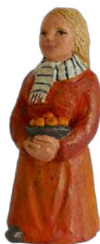
Femme à la corbeille 16 cm réf. : crA COR. 44 € TTC