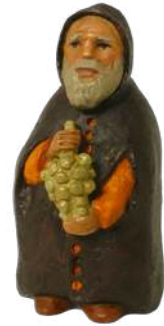
Berger à la grappe 9,1 cm crB GRA. 24,90 € TTC