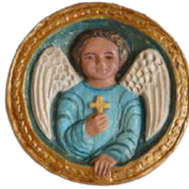
Ange, médaillon (bleu clair) 11 cm ; réf. : brANG a. 30 € TTC