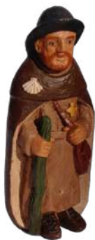
saint Jacques de Compostelle 21 cm ; réf. : muJAC. 39 € TTC