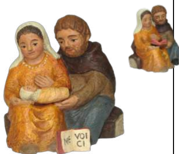
Marie et Joseph, Jésus & livre 12,7 cm. crA M&J. 59 € TTC