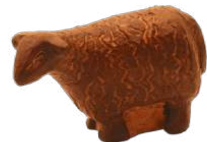
Brebis d'Ouessant 5,5 x 3,5 x 3 réf. : crB BRE d - 6 € TTC