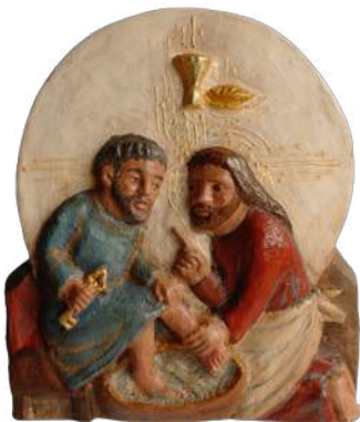
Lavement des pieds et Cène H = 18,7 cm ; brLAV c. 42 €