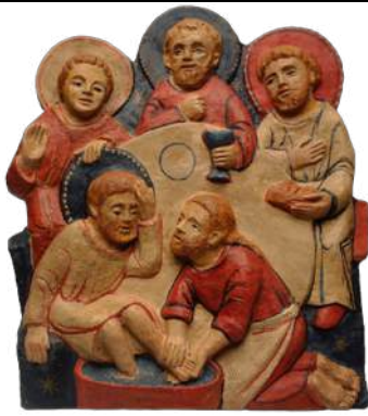
Lavement des pieds-Mandatum 24,5x22 cm. brMAN a. 149 €