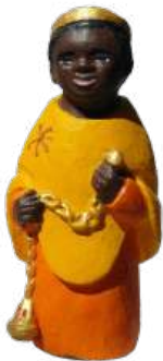
Mage d'Afrique. 8,8 cm réf. : crB AFR. 24,90 € TTC