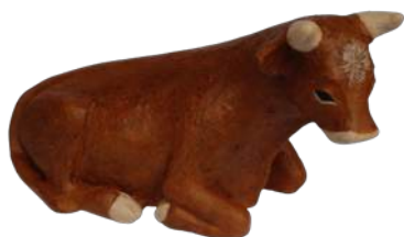
Bœuf 13 x 19 x 9 cm réf. : crA BOE. 49,50 € TTC