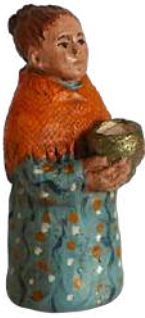
Femme à la jatte 8,7 cm réf. : crB JAT. 24,90 € TTC