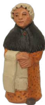
Grand-Mère 16 cm réf. : crA GDM. 44 € TTC