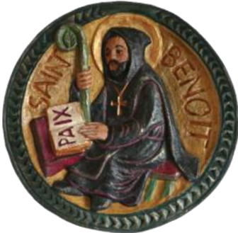
Saint Benoît. 30,5 cm réf. : brBEN. 75 € TTC