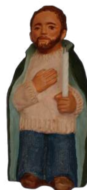
Joseph au cierge 17 cm. crA JOS. 44 € TTC