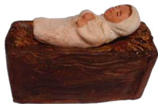
Enfant Jésus et berceau 5 x 7,5 x 3,5 cm. crA EJB. 24,90 € TTC