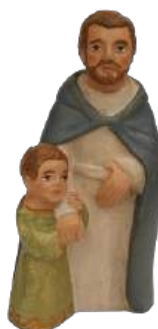
st Joseph et Jésus (vert) 11 cm réf. : stJ&J a. 42 € TTC