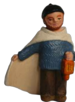
Joseph 9 cm réf. : crB JOS. 24,90 € TTC