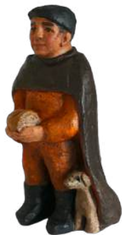
Berger au pain 17 cm réf. : crA PAI. 44 € TTC