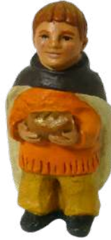
Berger au pain. 9 cm réf. : crB PAI. 24,90 € TTC