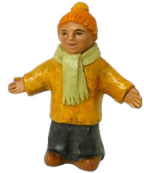
Ravi. 8,4 cm réf. : crB RAV. 24,90 € TTC