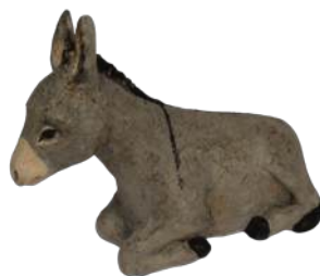
Âne ; 16 x 20,5 x 6,5 cm réf. : crA ANE. 49,50 € TTC