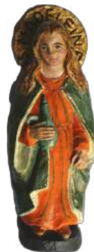
Marie-Madeleine 21,5 cm ; muMAD. 39 € TTC