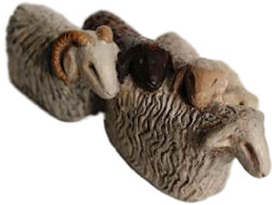
Moutons 7,5 x 16 x 9,5 cm (bloc) réf. : crA MOU. 48 € TTC