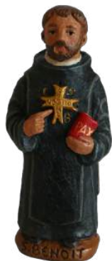
st Benoît à la croix 19,5 cm réf. : stBEN. 50 € TTC

NB : l'échelle relative des pièces n'est pas respectée.