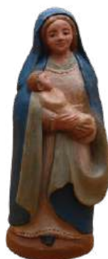
Vierge à l'Enfant 21 cm réf. stVIE. 57 € TTC