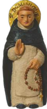
saint Dominique ; 21,5 cm réf. : muDOM. 39 € TTC