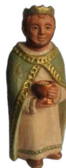
Mage d'Europe 17,5 cm réf. : crA EUR. 45 € TTC