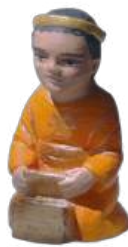
Mage d'Asie 6,4 cm réf. : crB ASI. 24,90 € TTC