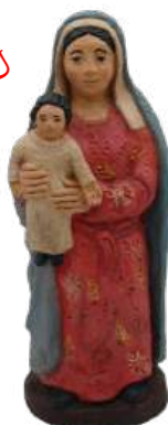
Vierge à l'Enfant 40 cm réf. srBRI, 231 € TTC