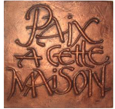
Paix ( finition cuivre). 17 cm ; réf. : brPAI a. 29 € TTC