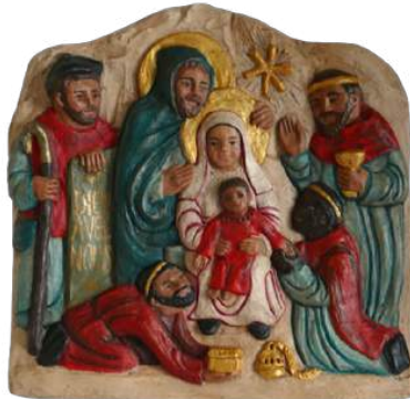
Épiphanie 24,5 x 25 cm réf. : brÉPI. 170 € TTC