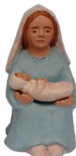
Marie (sans l'enfant) 12,5 x 6,5 x 8,2 cm. crA MAR 44 € TTC