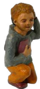
Etudiant au baladeur 12,5 cm réf. : crA ETG. 44 € TTC