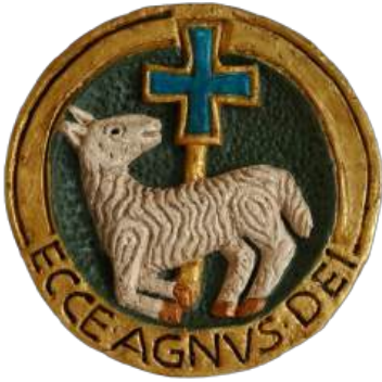
Agneau. 18 cm réf. : brAGN. 42 € TTC

Attache pour suspension murale. NB : l'échelle relative des pièces n'est pas respectée.