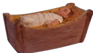
Enfant Jésus et berceau (bloc) 5x2,7 cm. crB EJB. 7,50 € TTC