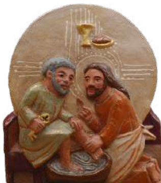
Lavement des pieds et Cène H = 18,7 cm ; brLAV d. 42 €