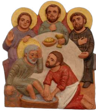
Lavement des pieds-Mandatum 24,5x22 cm. brMAN b. 159 €