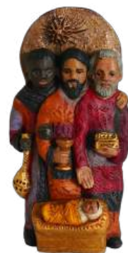
Trois Mages 24 x 12,5 cm réf. : brMAG 89 €