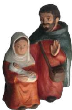
sainte Famille 17,5 cm réf. : stFAM. 68 € TTC