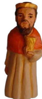
Mage d'Europe 9,1 cm réf. : crB EUR. 24,90 € TTC