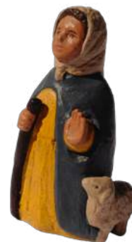
Bergère au bâton 8,4 cm réf. : crB BAT. 24,90 € TTC