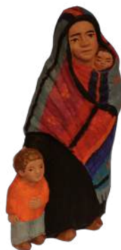
Migrante 16 cm ; crA MIG. 44 €