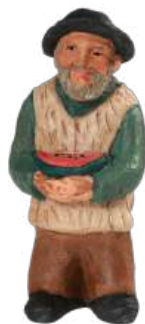
Berger à la pastèque 17 cm réf. : crA PAS. 44 € TTC