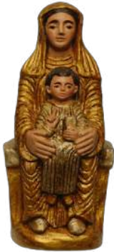
Vierge romane (dorée) 20 cm réf. : muROM a. 54 € TTC