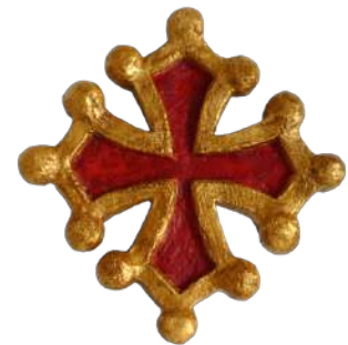
Croix occitane 14,5 cm réf. : muOCC. 31 € TTC