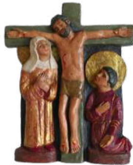
Calvaire (fond sombre) 21 cm. réf. : brCAL a. 103 € TTC