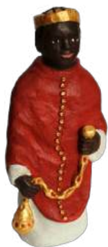
Mage d'Afrique 18,5 cm réf. : crA AFR. 45 € TTC