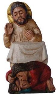
Marie-Madeleine et Jésus (polychr.) 25 cm brMAD a. 80 €