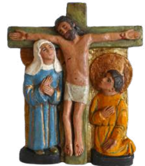
Calvaire (fond or). 21 cm. réf. : brCAL b. 103 € TTC